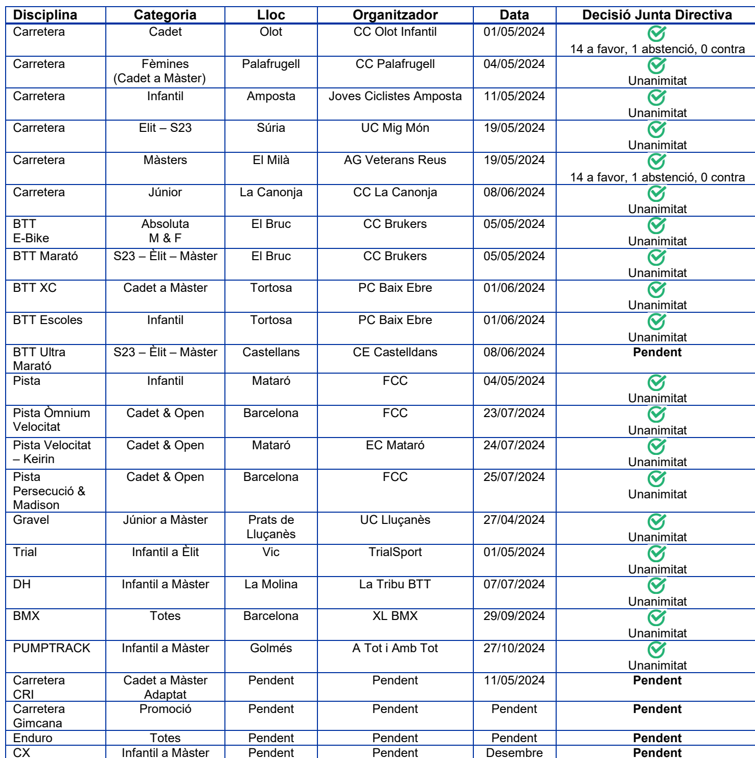
Taula 1: Resum dels Campionats de Catalunya 2024 presentats a Junta Directiva