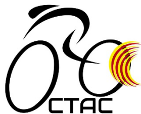
Il·lustració 1: Opció 1