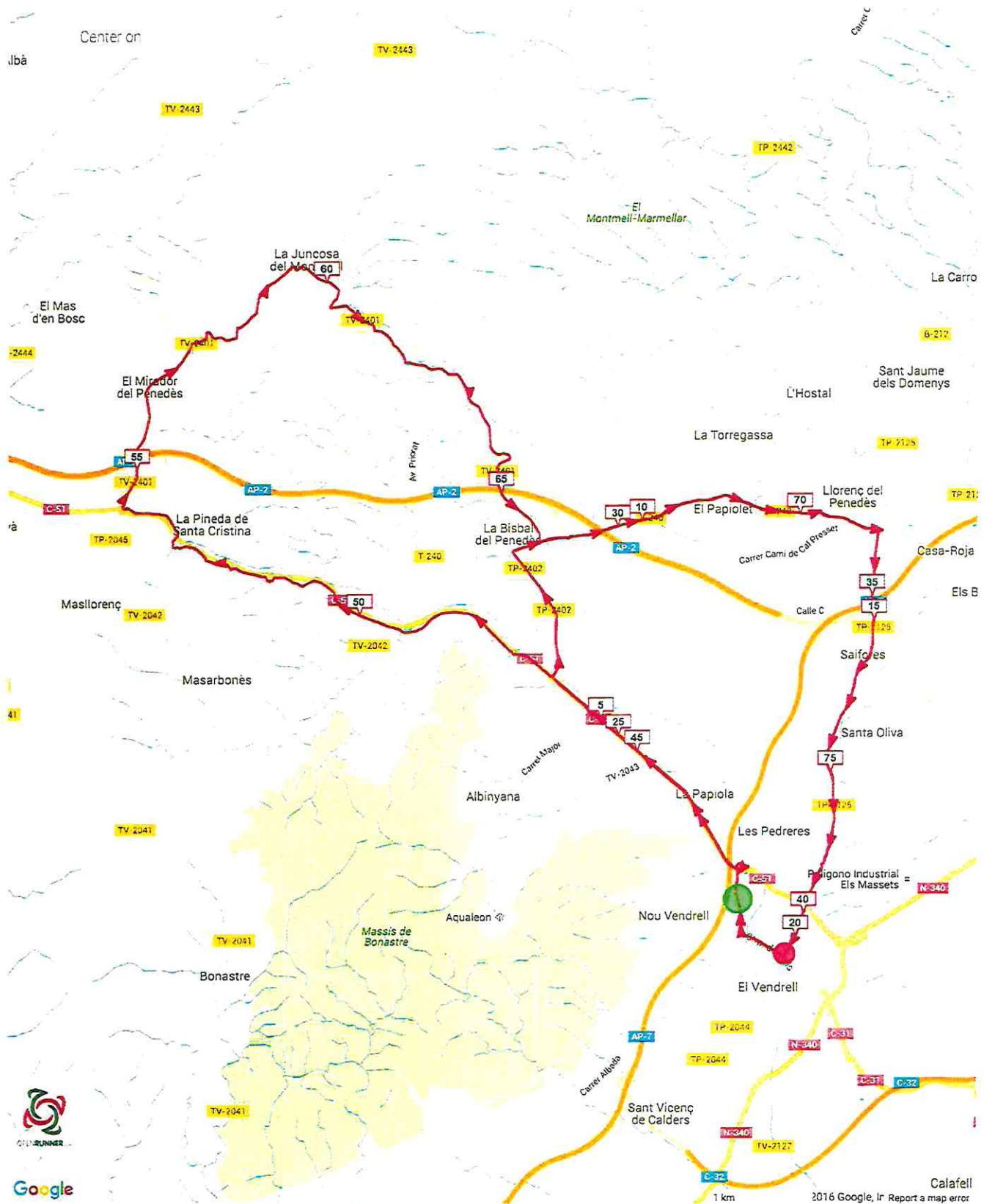
©2016 www.openrunner.com Route #4385958 - Cursa Social El Vendrell 2015 - Road Cycling, 77.881 (km) : el Vendrell -> el Vendrell

Reproduction rights are restricted to personal and private use only. When practicing your activity, respect the properties and private roads.