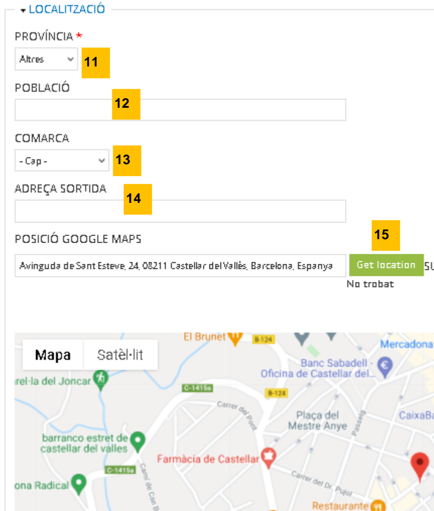
Il·lustració 5: Pas 5 – Afegir la ubicació de l'activitat esportiva