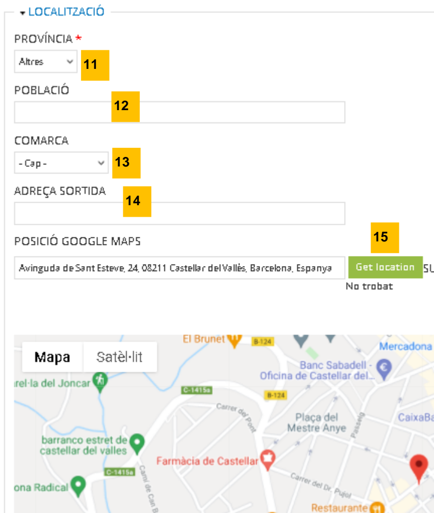
Il·lustració 5: Pas 5 – Afegir la ubicació de l'activitat esportiva