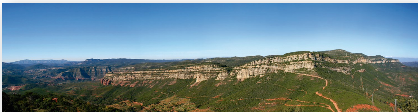
CINGLES DE BERTÍ

L'esdeveniment comptarà a més amb tot un seguit d'activitats artístiques, lúdiques i culturals paral·leles.