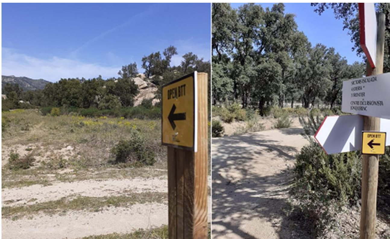
Circuit balisat a l'entorn dels menhirs que hi ha la falda de l'Ermida de Santa Llucia