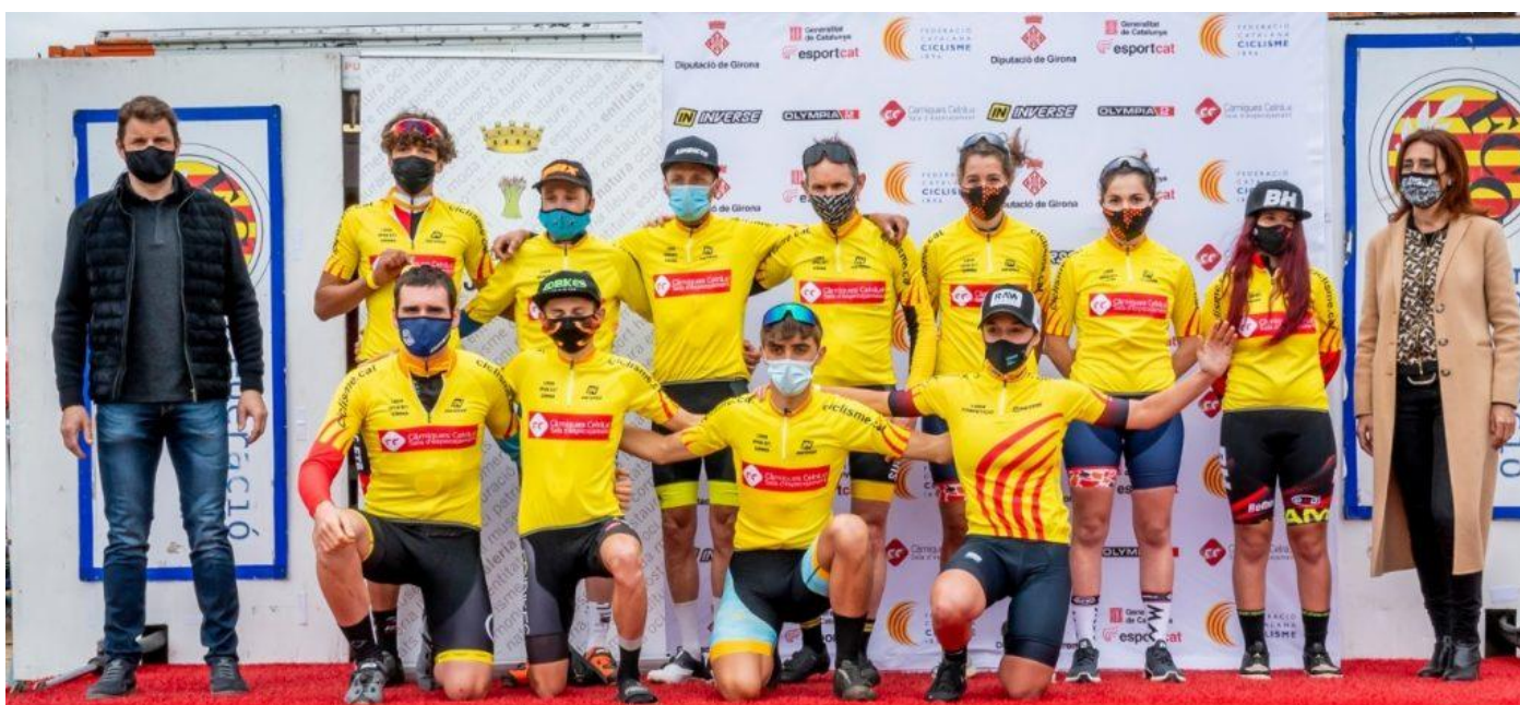
Líders de l'Open BTT Girona 2021 – Fotografia: Falgués Fotografia

Contacte: Tramuntana Xtrem: 672 384 669 – jepcoromines@gmail.com